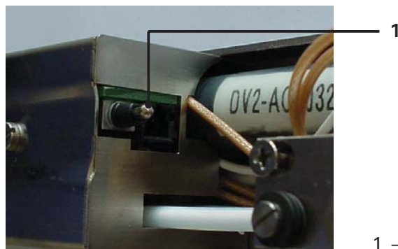
1 – Interrupteur d'encre